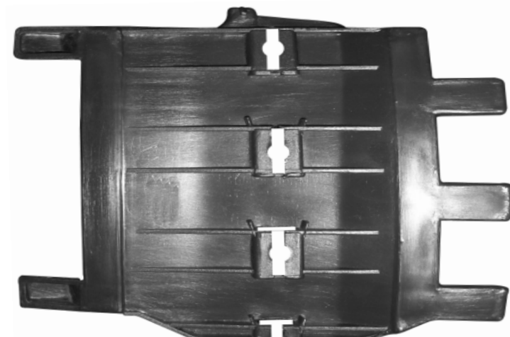
SUPORTE DO PARA-CHOQUE DIANTEIRO FORD KA