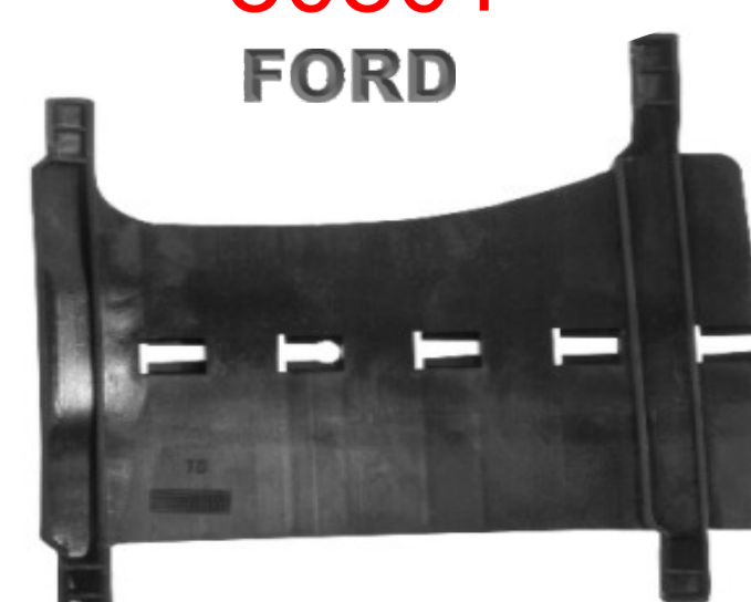
SUPORTE DO PARA-CHOQUE TRASEIRO FORD KA L. ESQUERDO