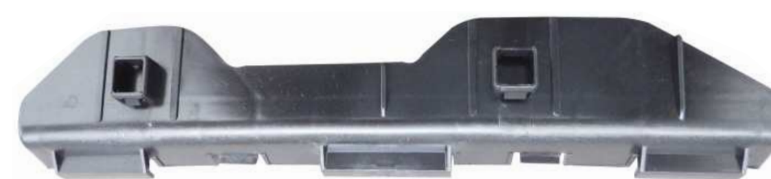
SUPORTE DE FIXAÇÃO DO PÁRA-CHOQUE TRASEIRO TOYOTA COROLLA 2003 / 2007