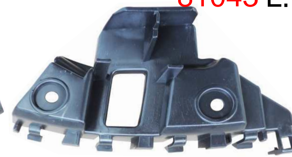
SUPORTE DE FIXAÇÃO DO PÁRA-CHOQUE DIANTEIRO VW JETTA 2010 / 2015