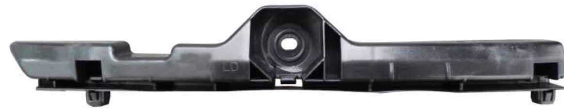
SUPORTE DE FIXAÇÃO DO PÁRA-CHOQUE DIANTEIRO TOYOTA HILUX 2005 / 2011