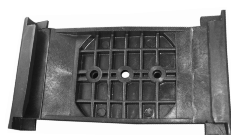
SUPORTE DA PONTEIRA PARA-CHOQUE TRASEIRO MONZA TODOS