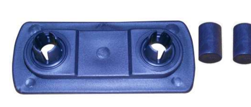
SUPORTE PARA-CHOQUE DIANTEIRO GOL / VOYAGE / PARATI / SAVEIRO