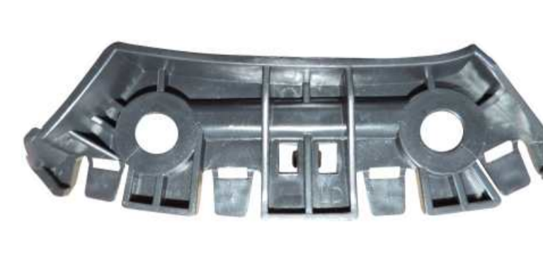
SUPORTE DE FIXAÇÃO DO PÁRA-CHOQUE DIANTEIRO VW UP 2014 >>