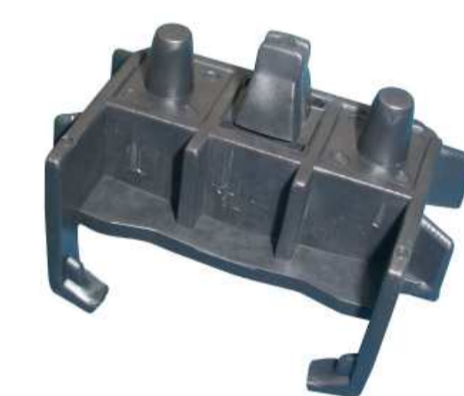
SUPORTE DO PARA-CHOQUE DIANTEIRO CORSA 84 / 96