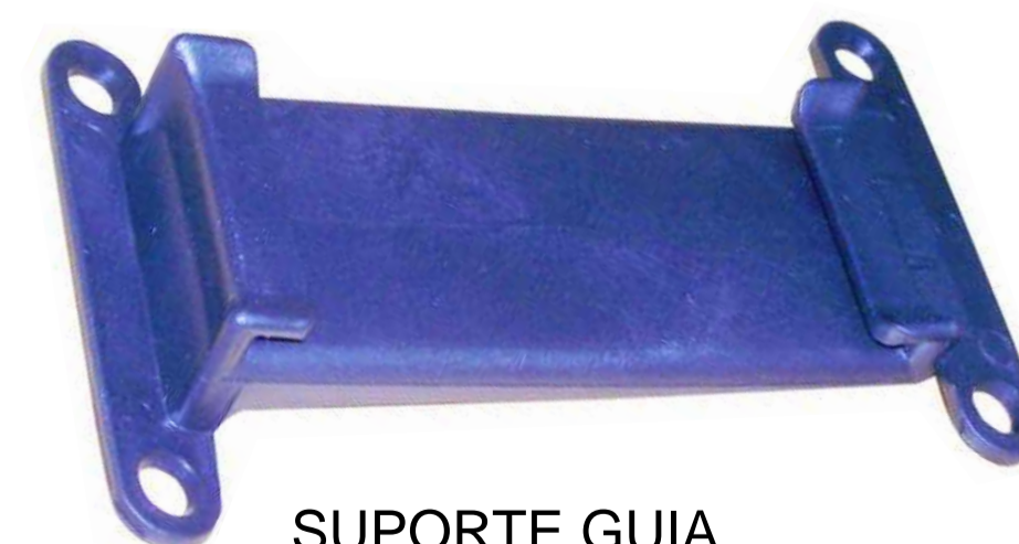
SUPORTE GUIA PARA-CHOQUE GOL / VOYAGE PARATI / SAVEIRO