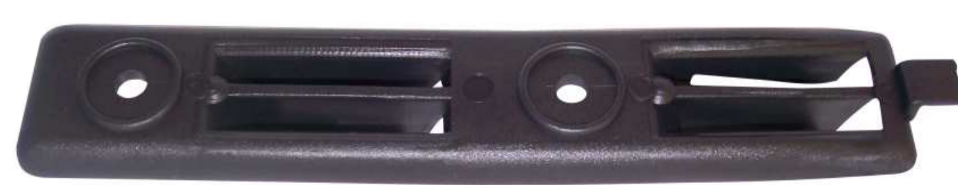
SUP.LATERAL PARA-CHOQUE GOL G.3 L.D / L.E