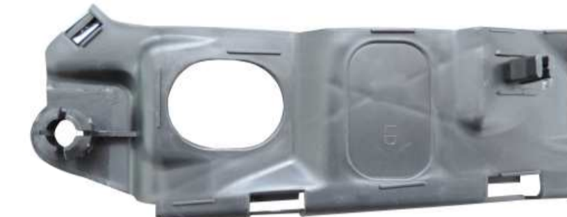
SUPORTE DE FIXAÇÃO DO PÁRA-CHOQUE DIANTEIRO CORSA / MONTANA 2015