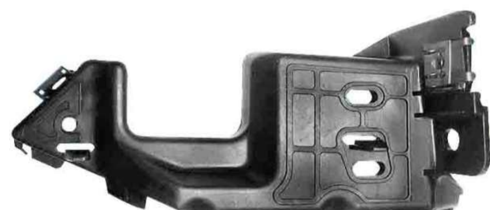
SUPORTE DE FIXAÇÃO DO PÁRA-CHOQUE DIANTEIRO CELTA / PRISMA 2008 >