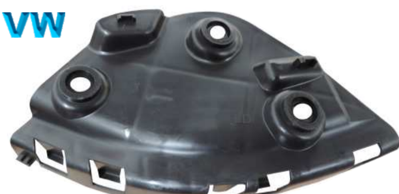
SUPORTE DE FIXAÇÃO DO PÁRA-CHOQUE DIANTEIRO FOX 2010 / 2014