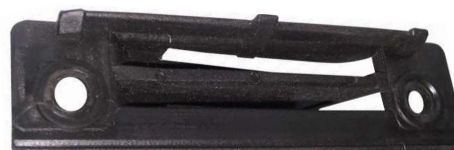
SUP.LATERAL PARA-CHOQUE TRASEIRO GOL G.3