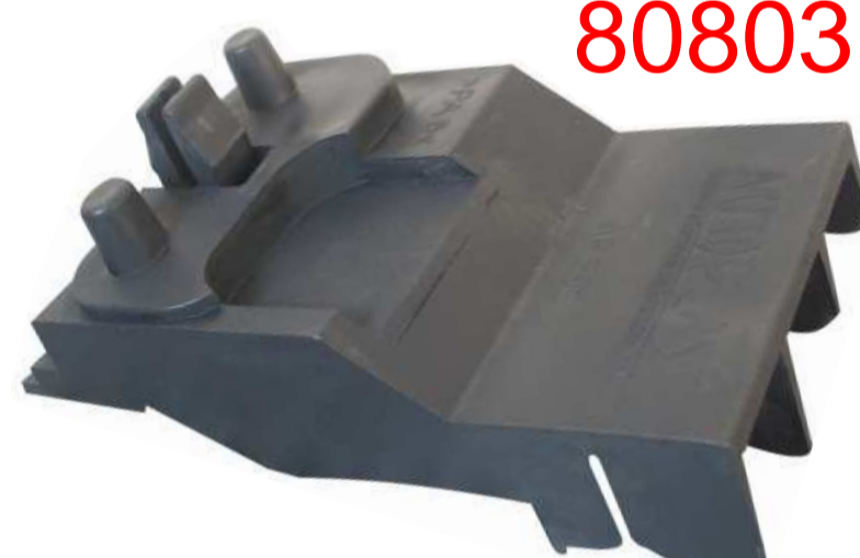
SUPORTE DO PARA-CHOQUE DIANTEIRO CORSA L.DIREITO 2000 >>>