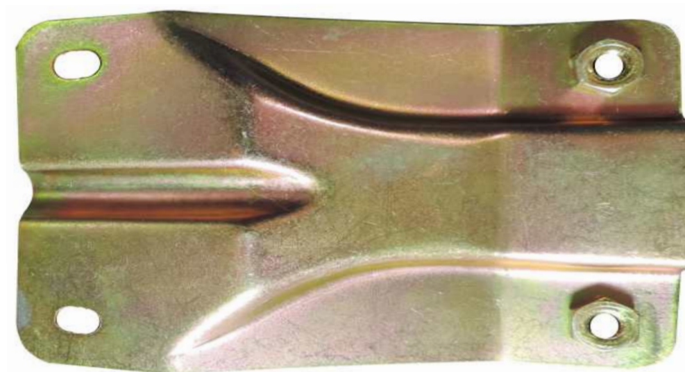
SUPORTE METALICO DA PONTEIRA PARA-CHOQUE TRASEIRO D 20 / A 20 / C 20