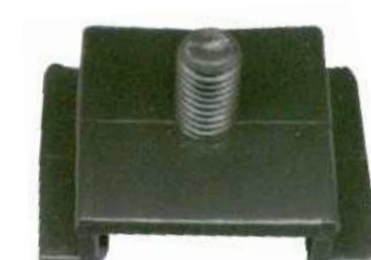
SUP.PARA-CHOQUE GOL/VOY/ PARAT/SAV.