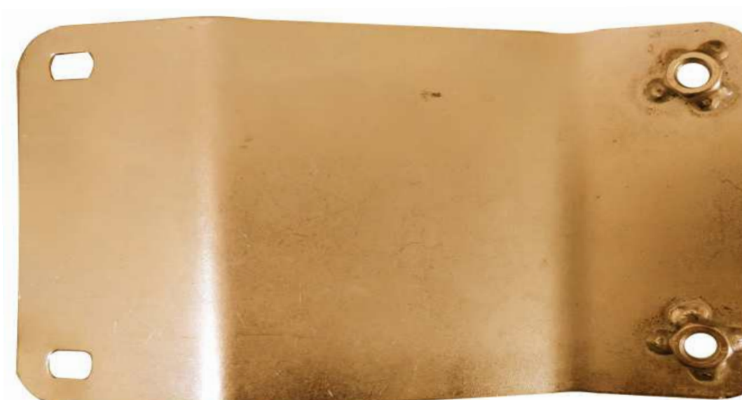
SUPORTE METALICO DA PONTEIRA PARA-CHOQUE DIANTEIRO D 20 / A 20 / C 20