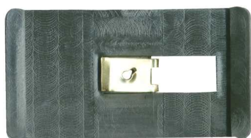
SUPORTE DA PONTEIRA PARA-CHOQUE DINAT. MONZA TODOS