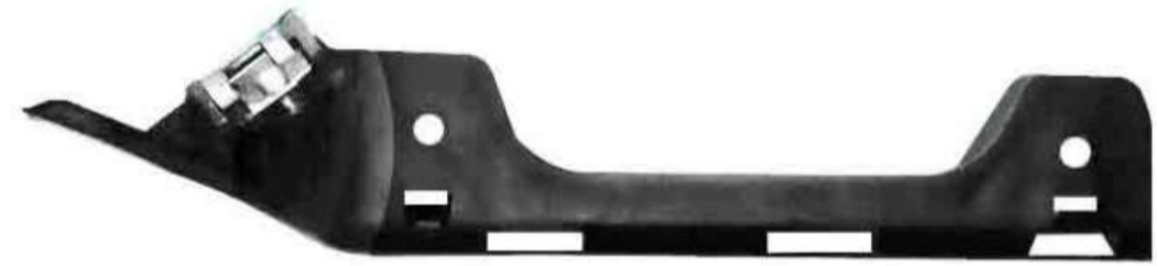
SUPORTE DE FIXAÇÃO DO PÁRA-CHOQUE DIANTEIRO ASTRA 99 / 2011