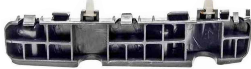
SUPORTE DE FIXAÇÃO DO PÁRA-CHOQUE DIANTEIRO HB-20 TODOS