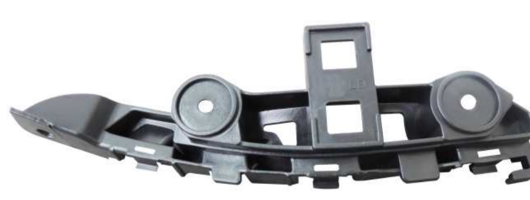
SUPORTE DE FIXAÇÃO DO PÁRA-CHOQUE DIANTEIRO GOL G6 2014 >>