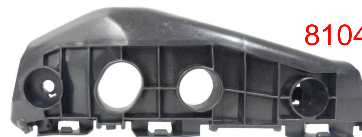
SUPORTE DE FIXAÇÃO DO PÁRA-CHOQUE DIANTEIRO TOYOTA COROLLA 2008 / 2012