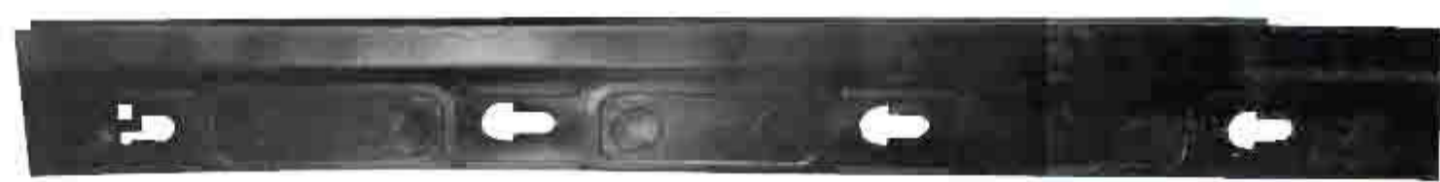
SUPORTE DE FIXAÇÃO DO PÁRA-CHOQUE TRASEIRO CLASSIC 2010 / 2016 L. ESQUERDO