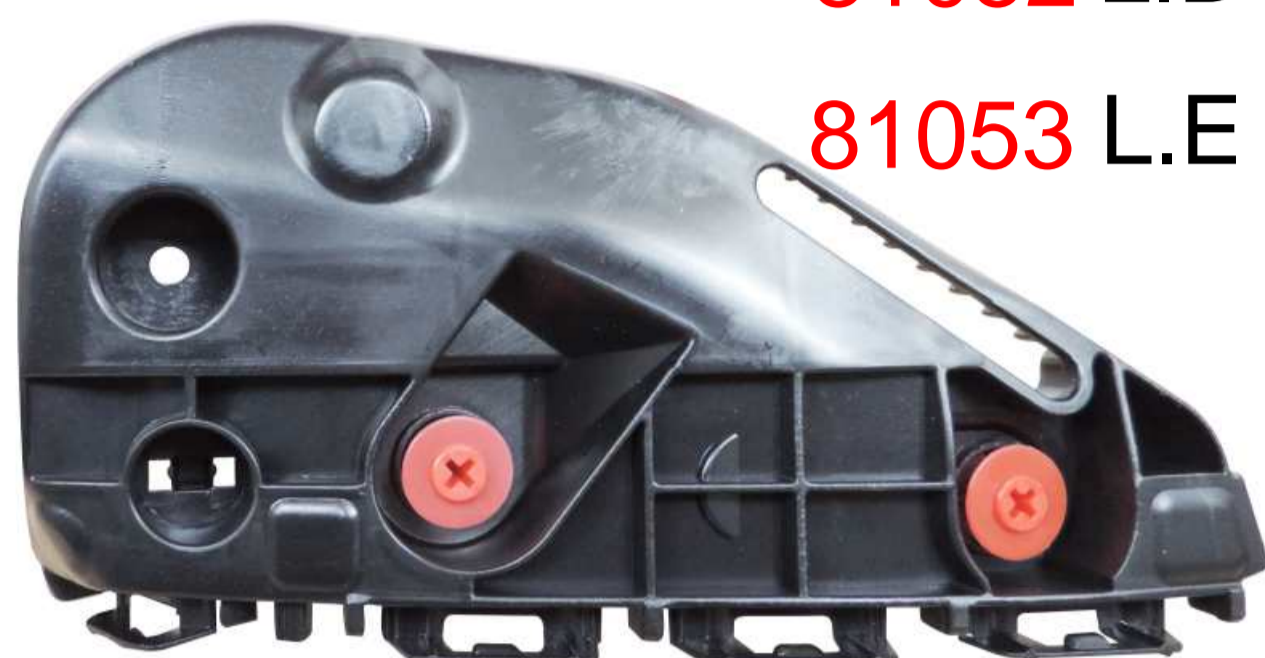
SUPORTE DE FIXAÇÃO DO PÁRA-CHOQUE DIANTEIRO TOYOTA HILUX 2016