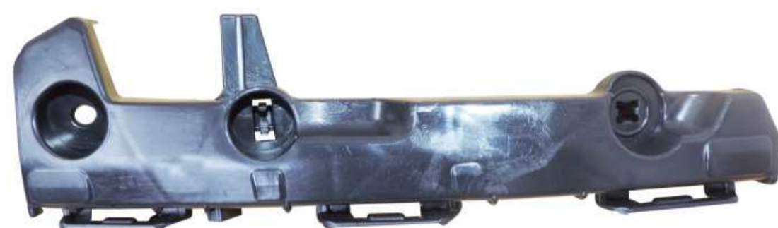
SUPORTE DE FIXAÇÃO DO PÁRA-CHOQUE DIANTEIRO TOYOTA HILUX 2012 / 2015