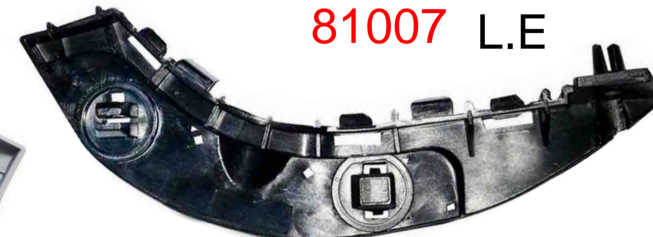
SUPORTE DE FIXAÇÃO DO PÁRA-CHOQUE DIANTEIRO HONDA NYL CIVIC 2008 / 2012