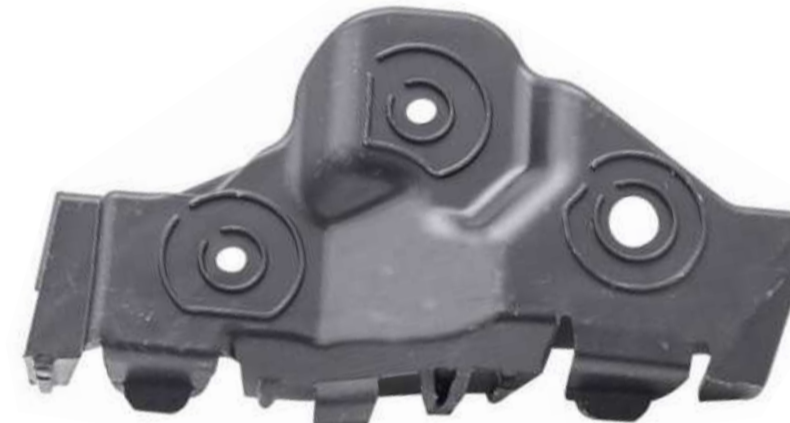
SUPORTE DE FIXAÇÃO DO PÁRA-CHOQUE DIANTEIRO ONIX / PRISMA 2015