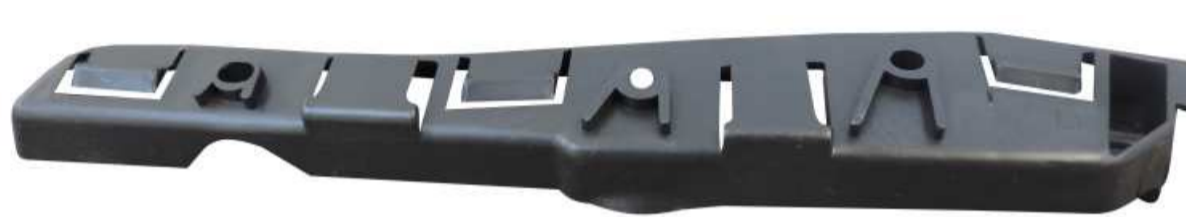
SUPORTE DE FIXAÇÃO DO PÁRA-CHOQUE DIANTEIRO RENAULT SANDERO 2009 / 2014