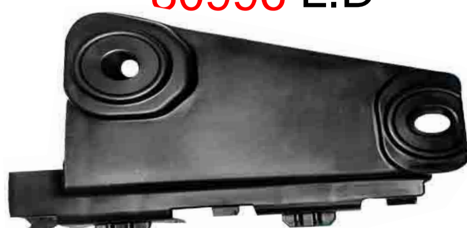
SUPORTE DE FIXAÇÃO DO PÁRA-CHOQUE DIANTEIRO GOL G5 2008 / 2012