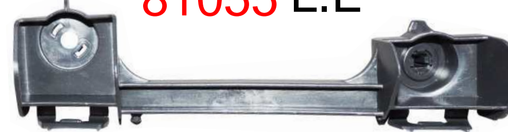
SUPORTE DE FIXAÇÃO DO PÁRA-CHOQUE DIANTEIRO TOYOTA ETIOS 2014 >>>