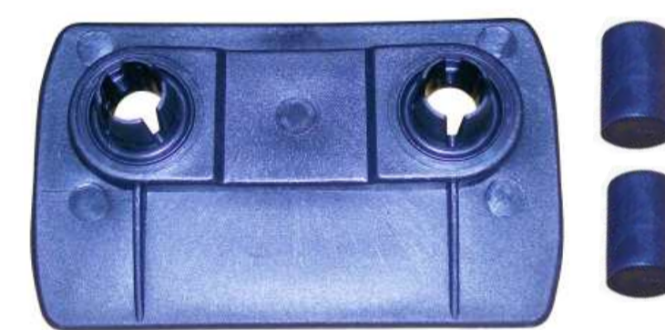
SUPORTE PARA-CHOQUE TRASEIRO GOL / VOYAGE / PARATI / SAVEIRO