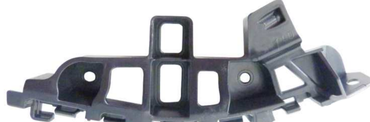
SUPORTE DE FIXAÇÃO DO PÁRA-CHOQUE DIANTEIRO FOX 2015