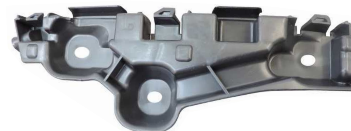
SUPORTE DE FIXAÇÃO DO PÁRA-CHOQUE DIANTEIRO RENAULT SANDERO / LOGAN 2015