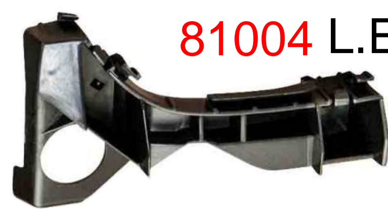
SUPORTE DE FIXAÇÃO DO PÁRA-CHOQUE DIANTEIRO TOYOTA COROLLA 2003 / 2007