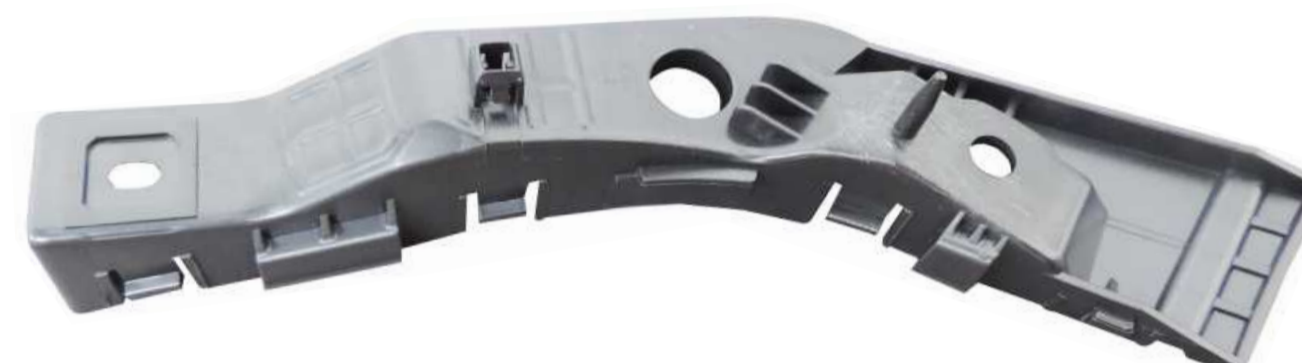
SUPORTE DE FIXAÇÃO DO PÁRA-CHOQUE DIANTEIRO HYUNDAI I30 2009 / 2012